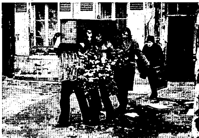
Le voyage d'Amélie